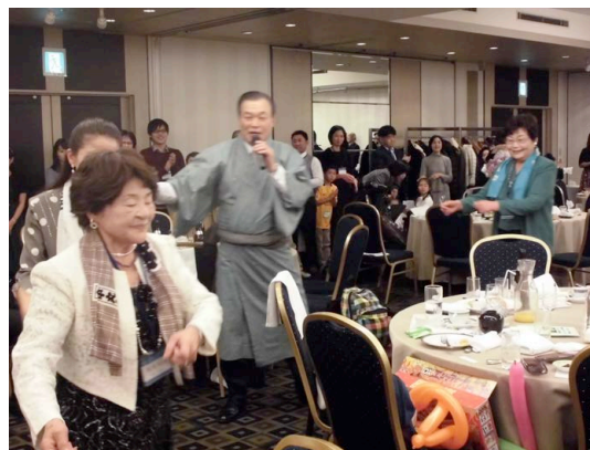
「手に手つないで」（全員で合唱）