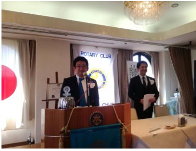
世界チャンピオン戦スポンサー協力をお願い