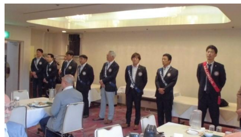
親睦活動委員会でお出迎えをしました。