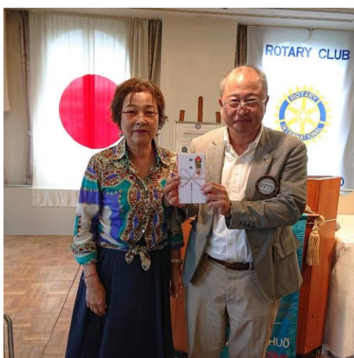
安東会員へ娘さん結婚祝いを贈呈

他のクラブの方に最後の日に「さすが中央さんだね」キリットした親睦委員の人たちが整列して出迎えてくれた事。そして和やかな例会だった事が印象的でしたと褒められました。