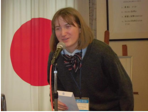
学校がお休みになって残念です。