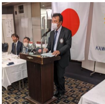
谷中社会奉仕委員長

谷中社会奉仕委員長より、市民祭りの報告 がありました。3日間の総売り上げは、1,376,600 円となりました。純利益は約250,000円 でした。その利益より、「このちゃんを救 う会」に200,000円の寄付を致しまし た。延べ人数で38名の方が参加下さい ました。