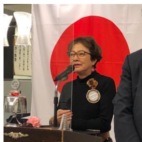
石川次期職業奉仕委員長