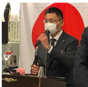
石川次期職業奉仕委員長