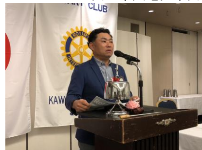
シンガポールについて・米山奨学会について