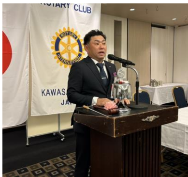
本多会長ノミニー