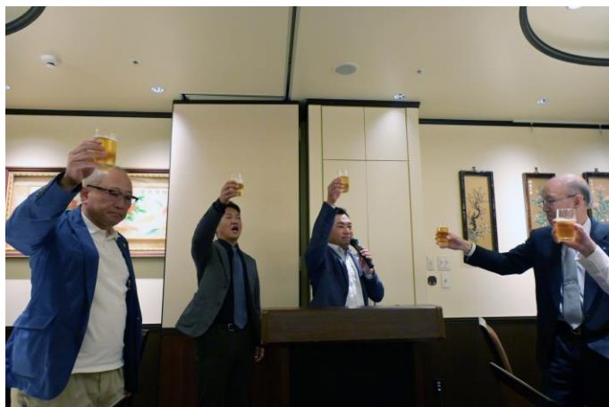
山口バスト会長乾杯のご発声