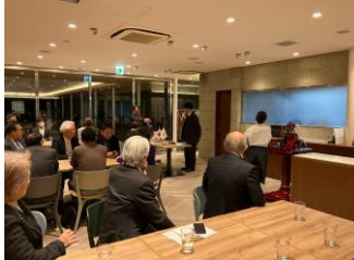
例会とお食事は少し移動しました。