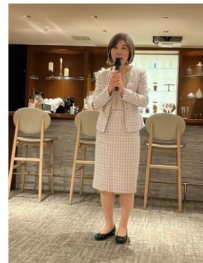
本多会長エレクトの締め挨拶