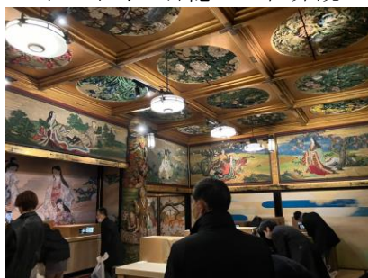
壁と天井の装飾が素晴らしかったです。