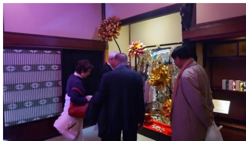
頂上の間はビックフラワーの世界でした。