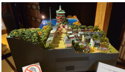
千と千尋の神隠しの世界観