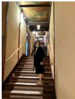
これから登り始めます。