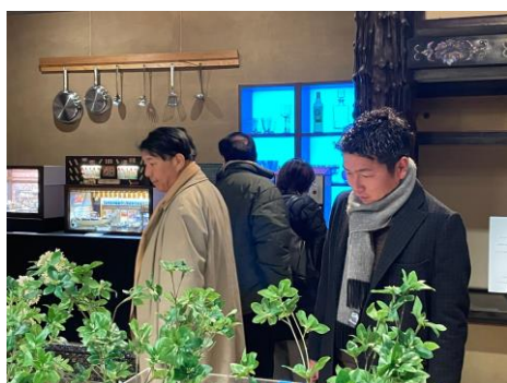
階段の途中にお部屋が何か所かありました。